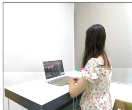
图3：侧后方第二机位效果图